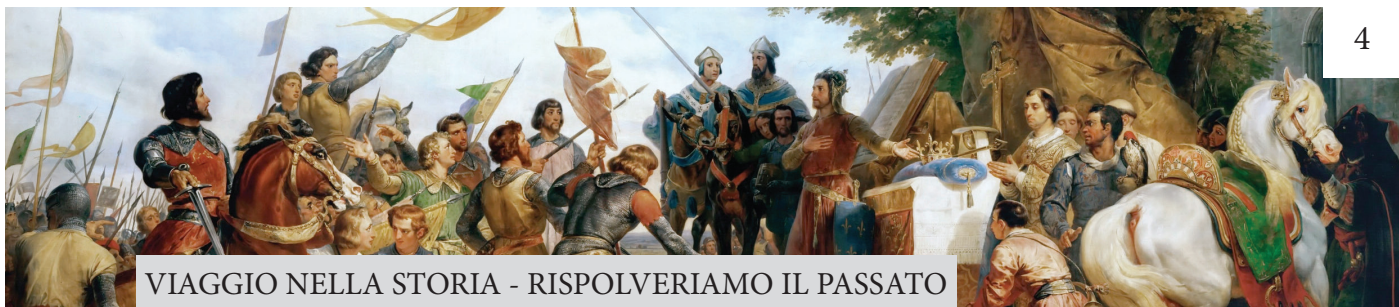
VIAGGIO NELLA STORIA - RISPOLVERIAMO IL PASSATO